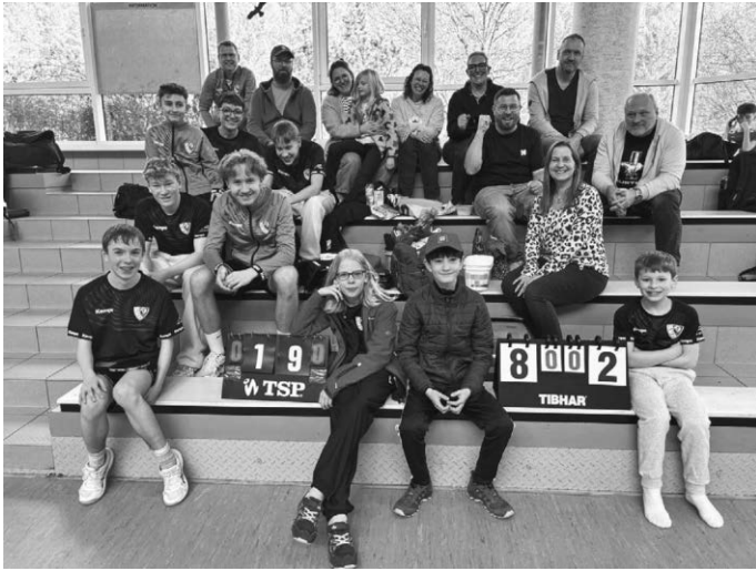
Die U13- und U19-Mannschaften des SV Pattonville gemeinsam mit Eltern, Fans und Trainer beim Auswärtsspiel – starke Unterstützung und tolle Stimmung.

Ende mit einem leistungsgerechten 5:5-Unentschieden endete. Am Abend waren schließlich die Aktiven an der Reihe. Die erste Mannschaft des SV Pattonville dominierte ihr Heimspiel gegen die TUG Hofen klar und gewann mit 9:1. Mit diesem Erfolg sicherte sich das Team bereits vorzeitig die Meisterschaft und damit den Aufstieg – ein großer Erfolg für die Mannschaft und den Verein. Auch die zweite Mannschaft sorgte für Spannung bis zum Schluss. In einem engen und umkämpften Spiel setzte sich der SV Pattonville II mit 9:7 gegen die KSG Gerlingen V durch und konnte damit ebenfalls einen wichtigen Sieg feiern. Der Spieltag zeigte einmal mehr den starken Teamgeist und die positive Entwicklung der Tischtennisabteilung des SV Pattonville. Mit vielen sehenswerten Ballwechseln, großem Einsatz und starken Nerven überzeugten Spielerinnen und Spieler in allen Mannschaften.