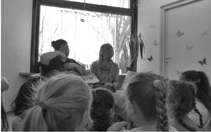
In der Kita Otterweg werden Bücher in Gebärdensprache vorgelesen.

Inhaltlich knüpft die Stadt an das frühere Bundesprogramm »Sprach-Kitas« an, das in Baden-Württemberg als Landesprogramm fortgeführt wird. Langfristig soll das Kornwestheimer Sprachkonzept in allen städtischen Einrichtungen fest verankert und kontinuierlich weiterentwickelt werden. Dabei werden auch aktuelle Entwicklungen wie das Sprachförderkonzept »Sprach-Fit« und der weiterentwickelte Orientierungsplan berücksichtigt.