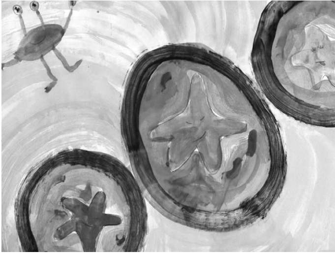
Beren Su Kolcak hat mit ihrem Bild den ersten Platz beim Malwettbewerb belegt.

die Programmpunkte erfahrungsgemäß schnell ausgebucht sind. Sollten sich Änderungen ergeben, werden die Teilnehmerinnen und Teilnehmer direkt informiert.