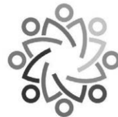
Freunde und Förderer der Realschule Remseck e.V.