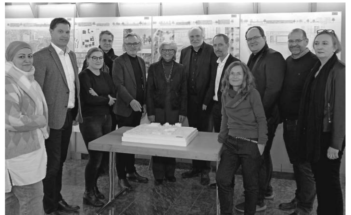
Vorstellung des Sieger-Entwurfs im Wettbewerb Schulcampus Ost