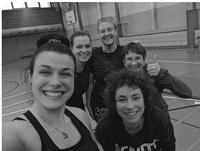
Beim Kurs Fitness Gymnastik kommt auch der Spaß nicht zu kurz

Mir ist wichtig, dass jeder an meinem Kurs teilnehmen kann. Das bedeutet, dass ich auf die Befindlichkeiten der Teilnehmer eingehe. Ich habe festgestellt, dass jeder unserer Gruppe gesundheitliche Besonderheiten hat, auf die ich aber gerne Rücksicht nehme. Knien ist zum Beispiel für dich nicht möglich? Kein Problem, dann überlege ich mir sofort eine alternative Übung, so dass du dennoch mit allen anderen zeitgleich mitmachen kannst. Vielleicht hat sich bei dir auch die Diastasenspalte zwischen den geraden Bauchmuskeln nach der Geburt deines Kindes noch nicht komplett zurückgebildet? Auch das hindert uns nicht daran, für dich eine passende Übung zu finden. Kurz gesagt: Bei uns ist jeder herzlich Willkommen, der Lust auf Bewegung hat!