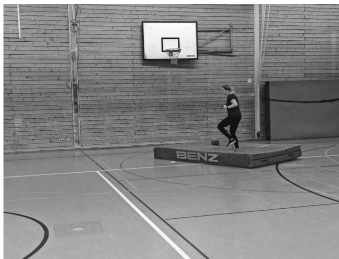
Mobilisation, Koordination, Kräftigung, Kraftausdauerzirkel, Übungen mit und ohne Ball... - Abwechslung ist Trumpf