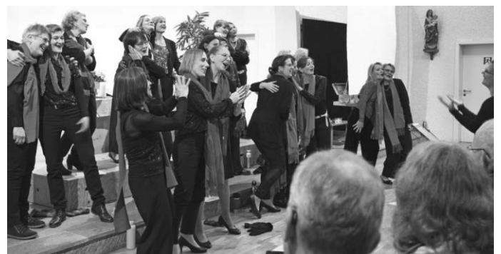
Bilder Ralf Swirsky