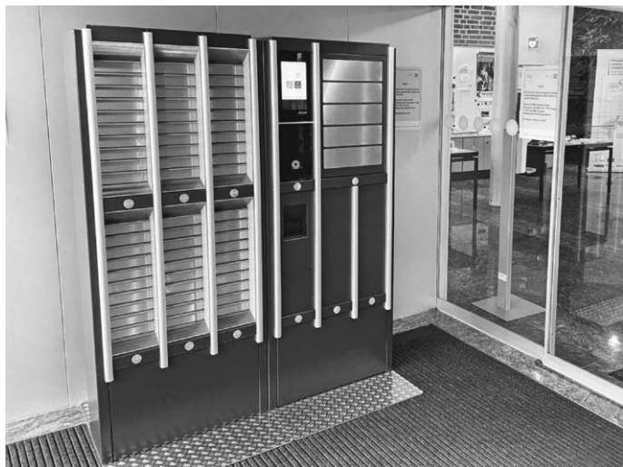
Das Abholterminal steht im Windfang des Rathaus-Haupteingangs ab sofort rund um die Uhr zur Verfügung.